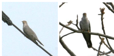
カッコウ (写真上2枚) ツツドリ (写真下)