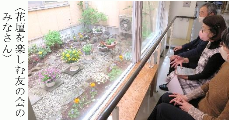
〈花壇を楽しむ友の会のみなさん〉

中庭が彩られ、足を止める患者さんや職員の方々が多く見受けられるようになりました。