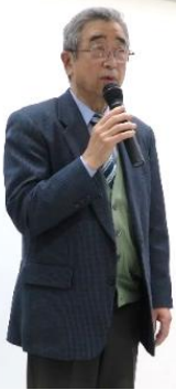
写真・三隅会長の挨拶

③居場所づくりについて 新年度は、居場所づくりのふれあいサロンについても、参加者をより多く募り充実させたいと抱負を語られました。