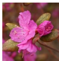
(エゾムラサキツツジ)