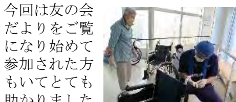
(ボランティア部：本波)